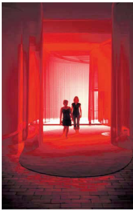
"El móvil de la Gina", 2007 / Foto: Pere Pratdesaba, Fundació Joan Miró.

La Fundació Joan Miró de Barcelona i la Fundació Caixa Girona ofereixen fins el proper 1 de novembre una mostra dedicada a l'artista d'origen suec, Pipilotti Rist. A través de 13 instal·lacions, el visitant podrà fer una immersió artística dins la seva producció de la qual cal dir que mai no ha deixat ningú indiferent.