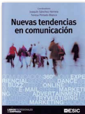
"Nuevas tendencias en comunicación" Autor: Varis autors Editorial: ESIC Editorial Pàgines: 280

CITA CÈLEBRE: "Quan hi ha adversitats és quan surt a la llum la virtut." Aristòtil (384 aC- 322 aC), filòsof grec.