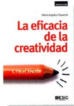
La eficacia de la creatividad. CreaCtivate. María Ángeles Chavarría. Esic Editorial.

Todos tenemos en nuestro interior un germen creativo que hay que potenciar. Gracias al aprendizaje de técnicas y estrategias adecuadas, se obtendrán soluciones y respuestas a los problemas, diseños y planificación de reuniones y proyectos, o la creación de nuevos productos o mejora de los ya existentes, por ejemplo.