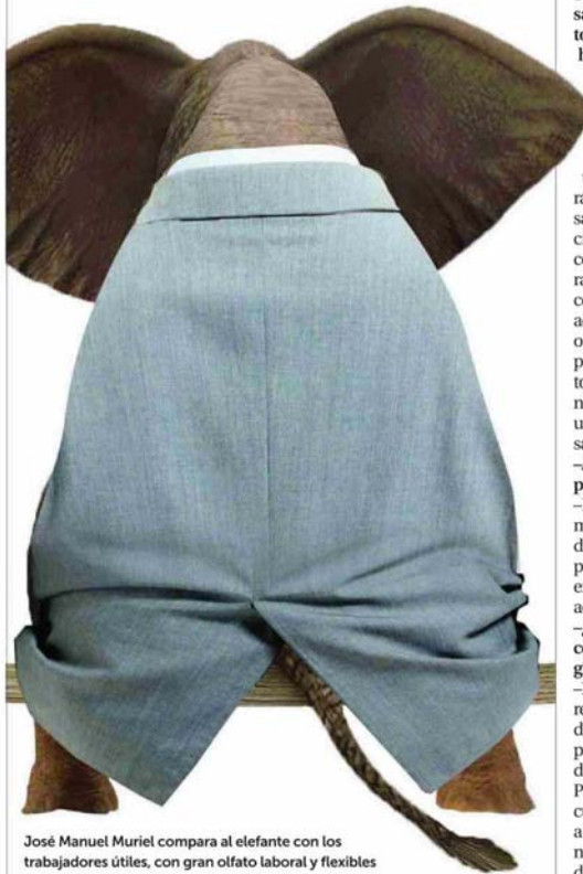
José Manuel Muriel compara al elefante con los trabajadores útiles, con gran olfato laboral y flexibles