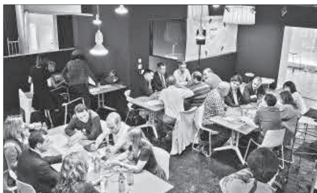
Jornada de networking celebrada por Innobasque