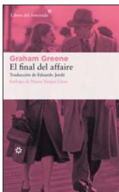
Graham Greene El final del affaire

Recuperación de uno de los libros más celebrados, aunque menos conocidos, de graham Greene , uno de los escritores ingleses más destacados del siglo XX, famoso sobre todo por sus novelas de espionaje que abordan el complejo asunto de la moral y del bien y el mal, como El tercer hombre (1950), El americano impenable (1955) o El poder y la gloria (1940). En este relato se descubre su faceta más autobiográfica con una narración situada en Londres, poco después de terminada la Segunda Guerra Mundial. Maurice Bendrix se encuentra con un amigo al que no veía desde hacía tiempo y se entera de que está casado con Sarah, que quien aquel mantuvo una relación durante la guerra. El amigo teme que su mujer le esté engañando y es Maurice quien se va a encargar de contratar los servicios de un detective privado para averiguar la verdad. Una novela de la que Vargas Llosa admira a Sarah, al que considera el personaje femenino más logrado de Greene.