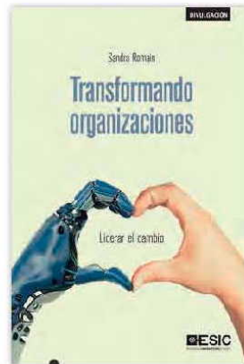
ESIC Sandra Romain 126 pág.