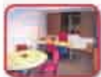
Despachos desde 1 a 7 puestos de trabajo