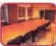
Sala de Reuniones

Disponga de su oficina de forma inmediata y sin inversión. Realice un estudio comparativo de costes y comprobará que resulta enormemente beneficiado con los servicios de ALARAZ VEINTE