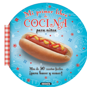
SUSAETA Ediciones Susaeta Mi primer libro de cocina para niños

En este libro, encontrarás, paso a paso, las instrucciones necesarias para conseguir las recetas más ricas que te puedas imaginar: rosquillas, tortitas, pizzas, canapés... y mucho más para los más pequeños de la casa.