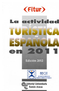
RAMÓN ARECES AECIT La actividad turística española en 2011

420 págs. 17 x 21cm Encuadernación: rústica ISBN: 978-84-9964-223-9 Precio: 29,90 euros