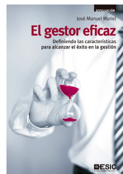
ESIC José Manuel Muriel El gestor eficaz Definiendo las características para alcanzar el éxito en la gestión

184 págs. 15 x 21,5 cm Encuadernación: rústica ISBN: 9788473568951 Precio: 15 euros