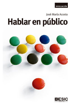
ESIC José María Acosta Hablar en público

Hablar en público es una de las experiencias más fabulosas que esperan al ser humano. La conexión con una audiencia es muy gratificante. Pero esperamos con miedo el momento de presentarnos ante ella. De ello depende muchas veces el reconocimiento de sus capacidades y su progresión como persona. Tanto a nivel profesional como al personal y social.