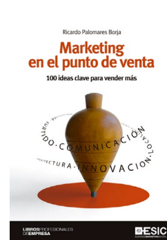
ESIC Ricardo Palomares Borja Marketing en el punto de venta 100 ideas clave para vender más

262 págs. 15 x 21,5 cm Encuadernación: rústica ISBN: 9788473568838 Precio: 20 euros