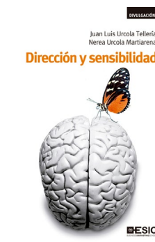
ESIC Nerea Urcola Martiarena / Juan Luis Urcola Tellería Dirección y sensibilidad

136 págs. 15 x 21,5 cm Encuadernación: rústica ISBN: 9788473568944 Precio: 15 euros