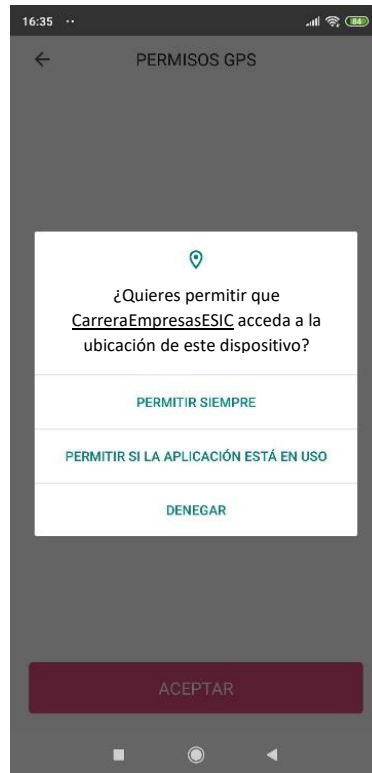
Captura 1. Seleccionar "PERMITIR SIEMPRE"